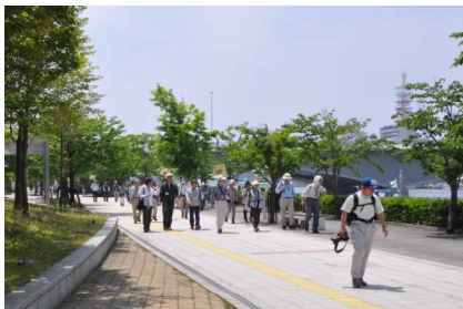
信濃川沿いをウォーク

博物館本館2階セミナー室で講義を受講した後、「信濃川左岸緑地(みなと・さがん)」・「柳都大橋」を経て、朱鷺メッセ展望室を目指しました。