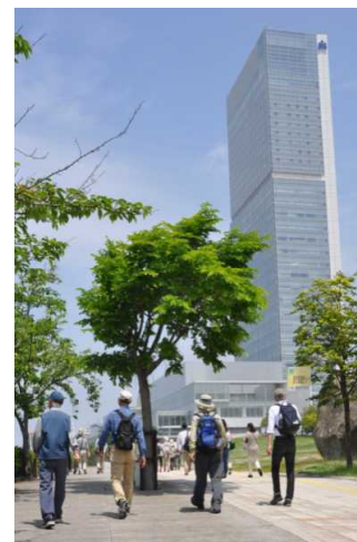
ゴールを目指して