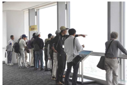
朱鷺メッセ展望室から