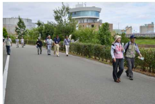
通船川沿いも歩きました。