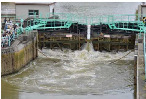
流れ込む水の勢いにびっくり！水位差が約2mもあります。

信濃川と阿賀野川をつなぐ、通船川に関する座学を聴講し、山の下閘門排水機場を見学し、舟運に関わる先人の知恵や、山の下周辺の歴史に触れることのできるウォークとなりました。