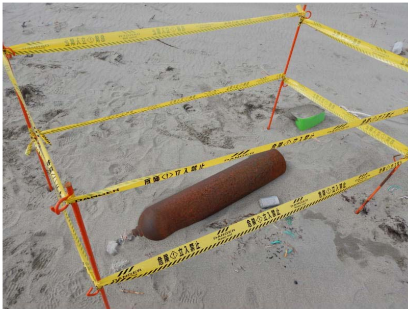
発見された海岸漂着物。点検翌日に撤去処理完了

なお、結果については北陸地方整備局ホームページ http://www.hrr.mlit.go.jp/river/infocheck/ でもご覧頂けます。