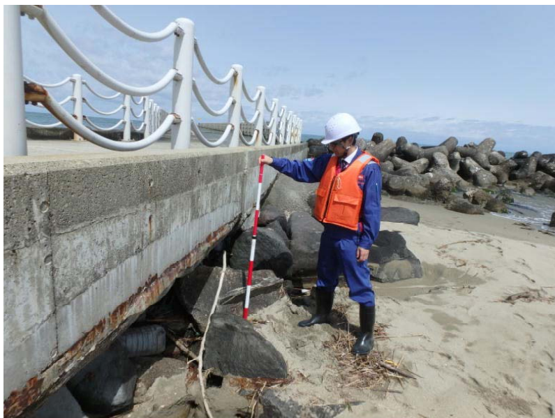
吸い出し調査を実施