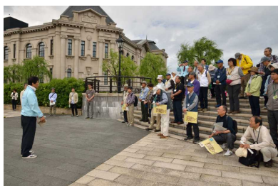
新潟市歴史博物館脇で主催者挨拶

博物館本館2階セミナー室で講義を受講した後、「信濃川左岸緑地（みなと・さがん）」・「柳都大橋」を経て、朱鷺メッセ展望室を目指しました。