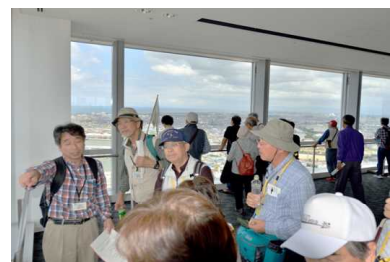
新潟港と中心市街地を眼下に