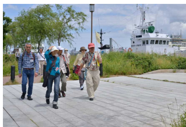
信濃川沿いをウォーク