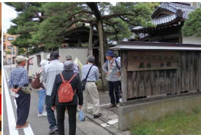
北方文化博物館の前にて

西大畑公園をスタートし、明治・大正の新潟港の近代化と西洋化を支えた歴史的建物を探訪しました。