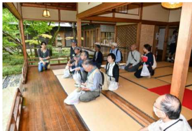
旧齋藤家別邸にて